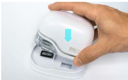
12. Put back into docking station

How to put the e-mark into operation: https://emark.colop.com/faq/setup