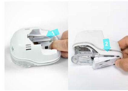
3. Open bottom latch