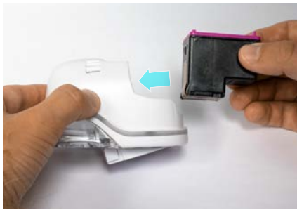
5. Insert cartridge