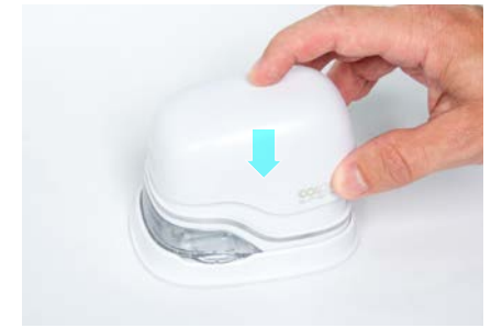
8. Close top cover