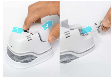
2. Remove battery and pull tab