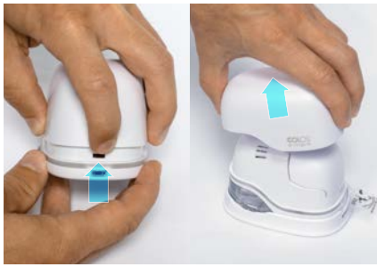
1. Remove top cover