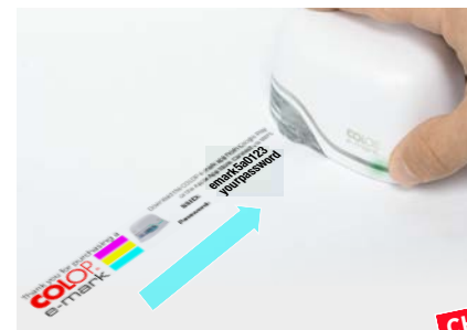
11. Print a test image and compare it to the imprint below to verify quality