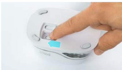
9. Turn on device