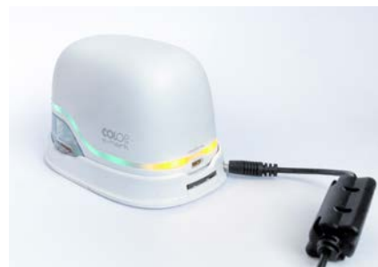
10. Charge e-mark