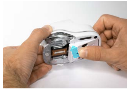
6. Close bottom latch