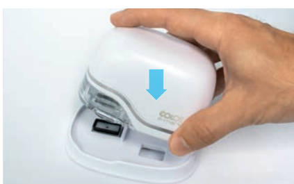
12. Coloque de volta na estação de suporte

13. Baixe o aplicativo e siga as instruções no aplicativo