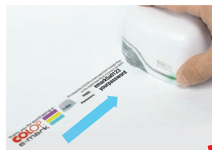
11. Imprima a imagem de teste e compare com a impressão ao lado para verificar a qualidade