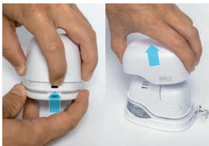
1. Remova a tampa superior