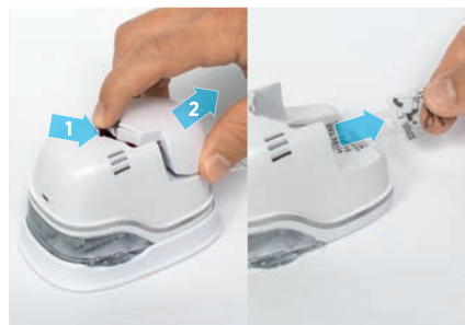
2. Remova a bateria e puxe a aba