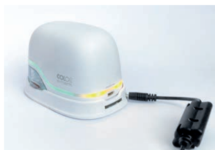
10. Carregar e-mark