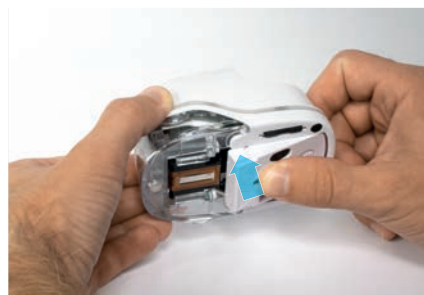
6. Feche a trava inferior