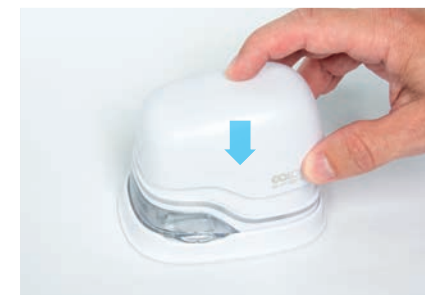
8. Reinsira a tampa superior