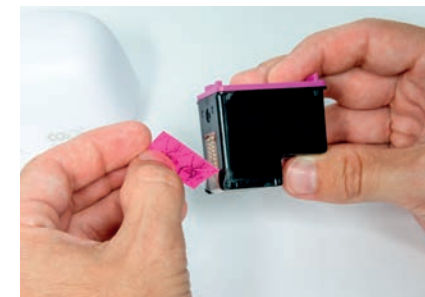
4. Remova o adesivo