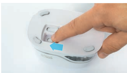
9. Ligue o aparelho