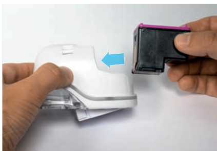
5. Insira o cartucho